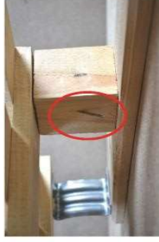
Wspornik drewniany z widocznym gwoździem Gwoździe lub nity wystające poza obrys palety