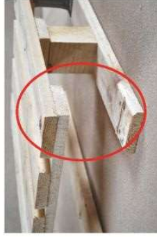
Brak któregokolwiek wspornika