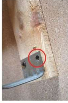
Brak gwoździ lub nitów