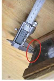
Wspornik metalowy o zaniżonej grubości (względem wartości nominalnej) Rdza na wsporniku metalowym jest niedopuszczalna