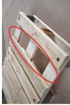
Brak deski górnej lub deski dolnej

Dopuszcza się palety szare, o ile ściemniały one wskutek naturalnych procesów starzenia się drewna.