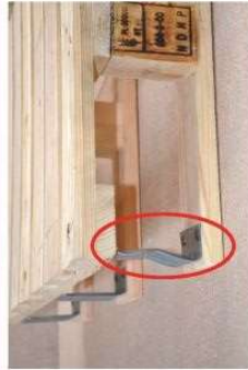
Górna i dolna część wspornika metalowego musi być prostopadła do jego części środkowej