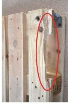
Występujący oflis na deskach Deska góra lub dolna z odłupaniem powyżej 15 mm